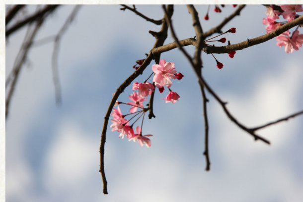
自今意思谁能说，一片春心付海棠——海棠花