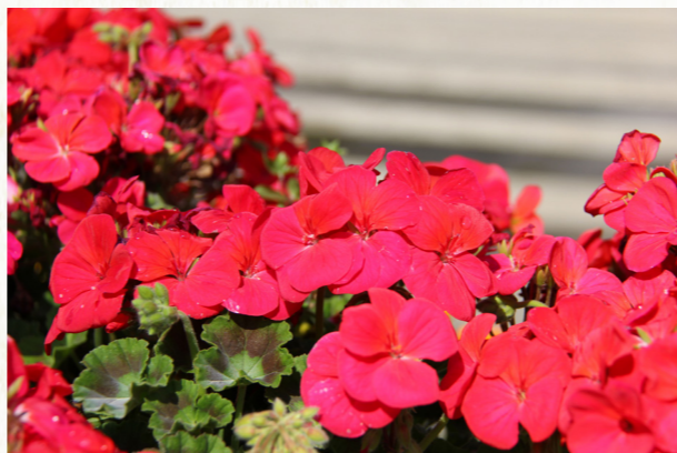
溢目光华绿叶肥，更薇叠蕊号称葵——天竺葵