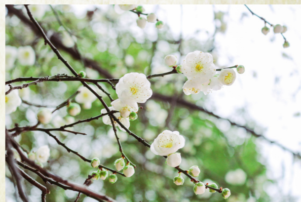
李子花开细枝娇，品洁温柔芬芳绕——李子花