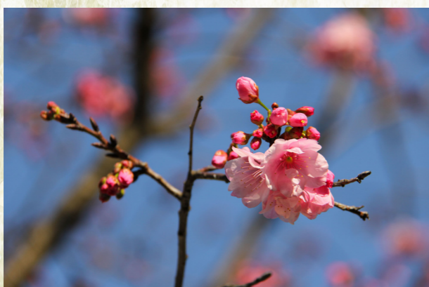
昨日南园新雨后，樱桃花发旧枝柯——樱花