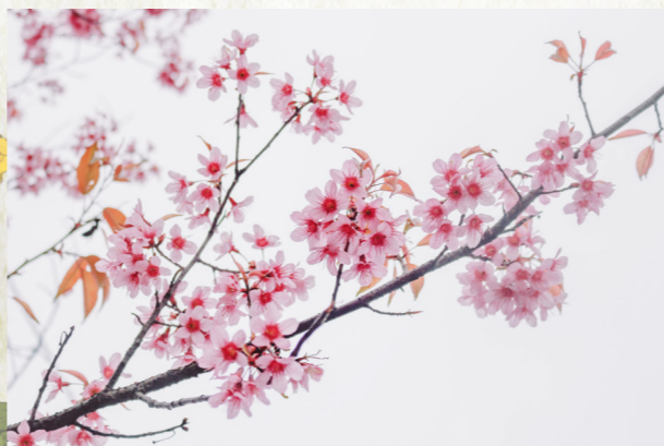
千年小兆一蝉蜕，丹台职亚扶桑君——扶桑花