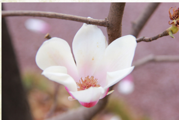
阶庭一笑玉兰新，把酒更、重逢初度——玉兰花