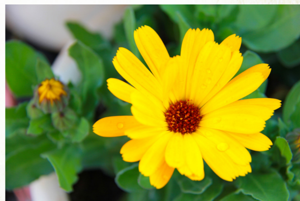
路畔田边片片金，炫人双眼韵清新——金盏菊