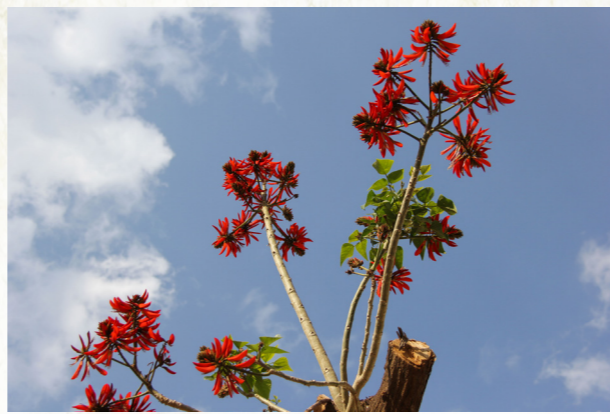
南国清和烟雨辰，刺桐夹道花开新——刺桐花

编者按：夜月一帘幽梦，春风十里柔情。春色无边，玳瑁斜插。她身着鹅黄素粉，行似扶风柔若无骨。她未施粉黛，肤似莹雪面色如玉。她沉溺在春光中的温柔教人怜惜。她，正是咱们的“校花”，她孳孳于着，校园中处处有她的身影，有她的芬芳。她游荡着，在等你回眸，在待你牵手，共度美好春光。“校花”百媚，望君采撷，无须难为情，这个春天，不妨漫步校园，与“校花”来一场浪漫约会。