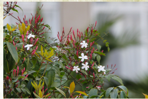
花之最弱者，亭亭之玉立——素馨花