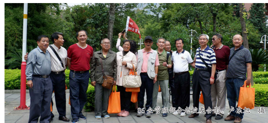
86企管班同学聚会合影

虽然他现在已经退休在家，但还是有很多企业常常打电话来咨询，一如退休前的忙碌，“虽然没有获得很大的成功，但感觉很充实，因为我们这代人一直都在拼，不断接触新的东西，都是新的挑战。”记者 卢东旭 邓晓麟