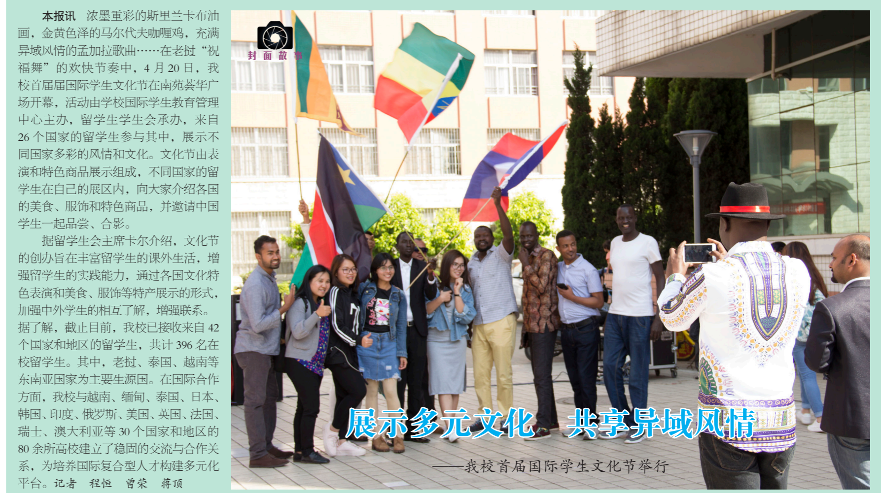
展示多元文化 共享异域风情

本届教(工)代会第二次会议提案委员会主任谢明斌作提案征集情况报告。本次会议共收到代表提案49件,涉及人事管理、职工福利、安全管理、教学管理、教辅服务、其他类综合管理等方面,提案委员会将协同相关部门尽快开展提案处理工作。闭幕会上,校党委书记郭五代、校长伏润民分别为教指委处长“锦云教授和财政与公共管理学院王敏教授颁发了“云南省三八红旗手”和“云南省巾帼标兵”的奖状。大会主席团成员王林、王晓萍、伏润民、全洪涛、李旭、李妍、杨晓红、吴应利、陈黎生、胡海彦、桂正华、徐宝春、殷红、郭五代、谢昌浩、缪小林,141名代表参加会议。各单位(部门)非教(工)代会代表的工会主席和党政主要负责人,正校级老领导、省市区人大代表和政协委员、民主党派基层组织负责人、校学生会主席等应邀列席会议。记者 王逸凡 柳晨仪 汪晓钰 王书琪 叶琪 王虹 卜一伊