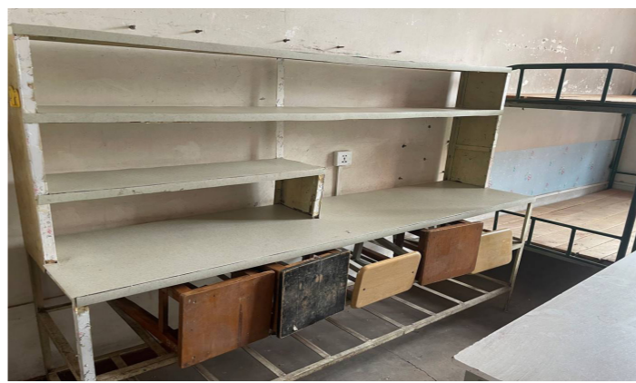
学生公寓维修改造建设项目

除了以上所列的6个项目，还有师生关心的校园网络速度问题，学校也已经与通信运营商协商，积极推动校园网络升级改造，5G覆盖校园建设也已经在路上……相信在师生的共同努力下，云南财经大学一定会变得越来越美，越来越好！（文字由宣传部综合）