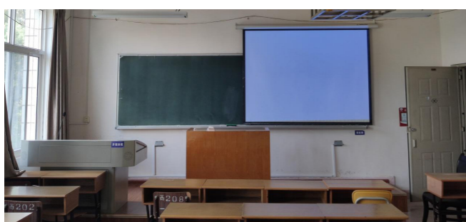
思源楼多媒体教室改造

成后，可满足200余人的舞台剧、报告会、文化沙龙、心理辅导、学习研讨等活动对空间的需求。建成后的“一站式”学生服务中心将重点为学校探索“一站式”学生社区综合管理模式，推进党组织、职能部门、服务单位等进驻学生社区开展工作提供实践场所。