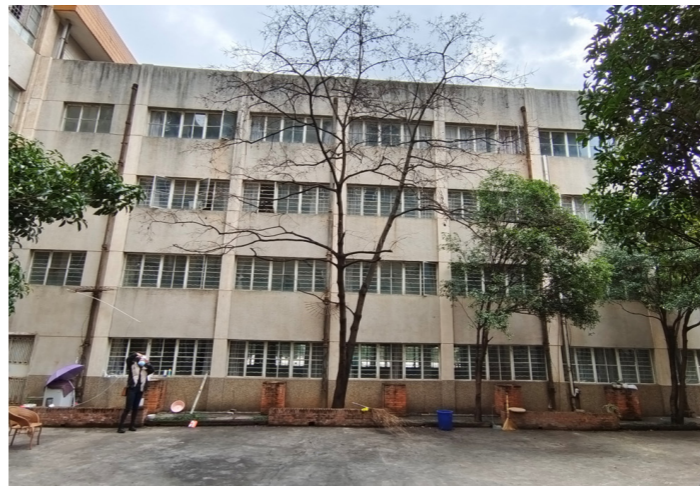
研究生教学综合楼装修改造

随着学校研究生招生规模的逐年扩大，为了缓解研究生教育的空间压力，满足学校研究生教育教学与办公需求，学校决定将实训楼装修改造为研究生教学综合楼（楼宇被命名为“行远楼”），供研究生教学科研使用。