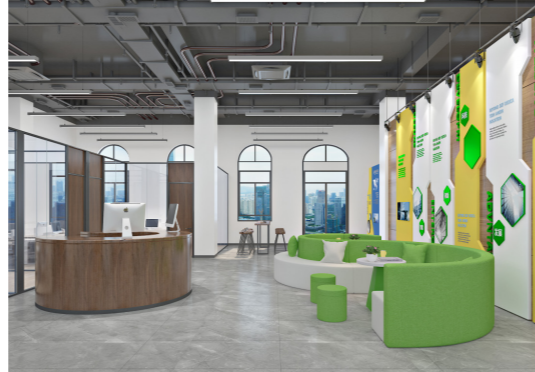
左上图为全景效果图，右上图为文化长廊效果图，右下图为学生服务大厅效果图。

成后，可满足200余人的舞台剧、报告会、文化沙龙、心理辅导、学习研讨等活动对空间的需求。建成后的“一站式”学生服务中心将重点为学校探索“一站式”学生社区综合管理模式，推进党组织、职能部门、服务单位等进驻学生社区开展工作提供实践场所。