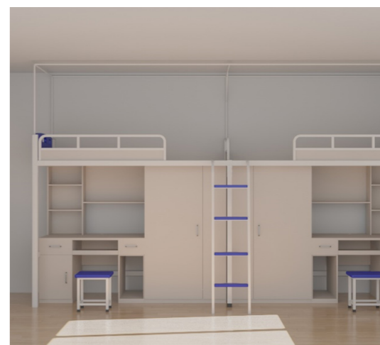
左上图为菁华苑学生宿舍实景图，右上图，右下图为改造升级后的效果图。