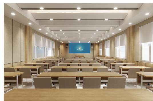
左上图为研究生教学综合楼内院实景图，右上为研究生教学综合楼内院效果图，右中为研究生教学综合楼合班教室实景图，右下为研究生教学综合楼合班教室效果图。