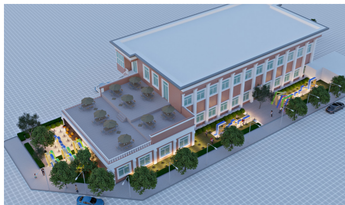
“一站式”学生社区服务建设项目

为持续推动学习贯彻习近平新时代中国特色社会主义思想主题教育走深走实，进一步改善校园学习生活条件、完善学校公共服务体系以回应师生和社会关切，近期，学校开始着手对龙泉路校区部分老旧宿舍、教学楼、学生社区和校园公共设施等校园学习生活硬件进行改造和质量提升。龙泉路校区“焕”新季，已经紧锣密鼓提上日程。