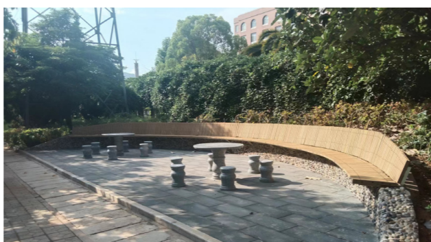
晨曦苑小广场石桌椅实景图。

今年以来，学校后勤产业集团实施3000元以下公共设施维修1522项，3000元以上公共设施零星维修30项，用于改善校园环境，共涉及金额99万余元，所有项目均已完成施工并投入使用。其中，室外公共设施重点维修项目4项，分别为南院公共区域更换破损沟盖板、修复绿化带花台项目，晨曦苑小广场石桌椅项目，南院北门围挡拆除项目及锤正山美术馆二楼平台更换防腐木地板项目。